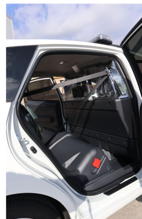
Kit de detinguts