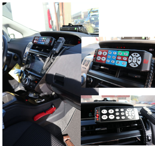
Quadre de comandaments i detall del comandament del pont