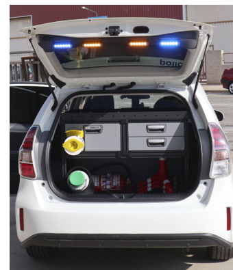
Llums porta posterior