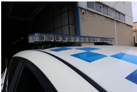
Puente de luces LEGEND

El pasado 20 de diciembre se hizo la entrega de cuatro nuevos vehículos eléctricos para la Policía Local de Sant Cugat del Vallès transformados en nuestras instalaciones. Los vehículos son del modelo NISSAN Leaf, los vehículos van equipados con un puente de luces LED de perfil bajo.