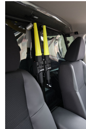
Linternas Kit detenidos