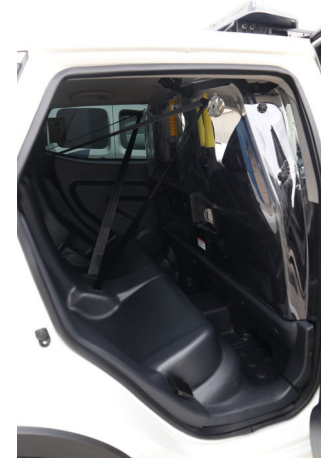
Kit de detenidos