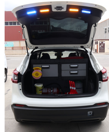
Luces puerta posterior