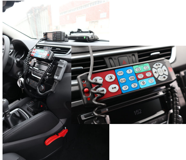
Cuadro de mandos y detalle del mando del puente